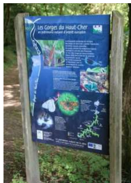
Panneau d'information Natura 2000 implanté à St-Genest