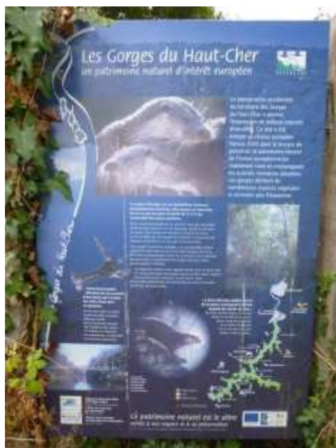
Panneau d'information Natura 2000 implanté au Petit- Cougour (Lignerolles)

En ce qui concerne les panneaux installés in situ et dans la suite des 1 er observations portées en 2015 ( panneaux du barrage de Rochebut / du barrage de Prat / du Château de l'Ours / des côtes de Nerdre ), 2 panneaux ont été visités courant 2016 afin de juger de leur état ( Petit-Cougour à Lignerolles et St-Genest ). Ces 2 panneaux sont jugés en assez bon état :