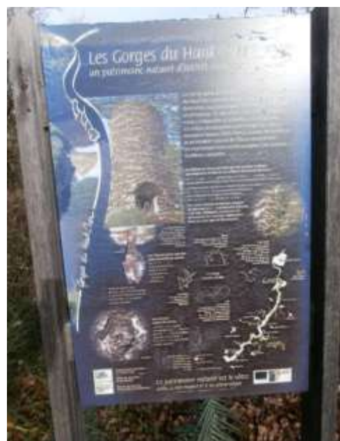
Panneau Natura 2000 aux abords du Château de l'Ours, CEN Allier 16/12/15

Ces 2 derniers panneaux sont dégradés, conséquence semble-t-il des expositions aux intempéries pour celui du Château de l'Ours et d'incivilités pour celui implanté sur Nerdre ( photos ci-contre ).