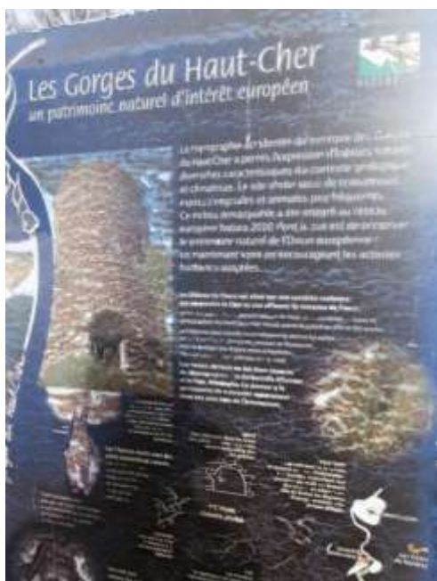
Panneau Natura 2000 aux abords du Château de l'Ours, CEN Allier 16/12/15