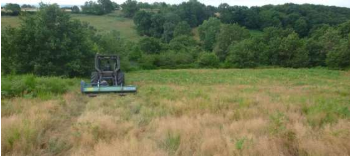
Opération de broyage le 28/07/2016 sur une zone de lande restaurée des Côtes de Nerdre

Un broyage d'une zone préalablement restaurée (contrat Natura 2000 ; 2010/2014) et sujette à une problématique de colonisation par la Fougère aigle (actions spécifiques mises en œuvre durant le contrat) a été de nouveau broyée, le 28 juillet 2016.