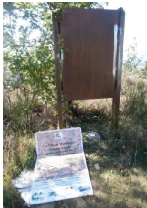
Panneau Natura 2000 aux abords des landes de Nerdre CEN Allier sept. 2015