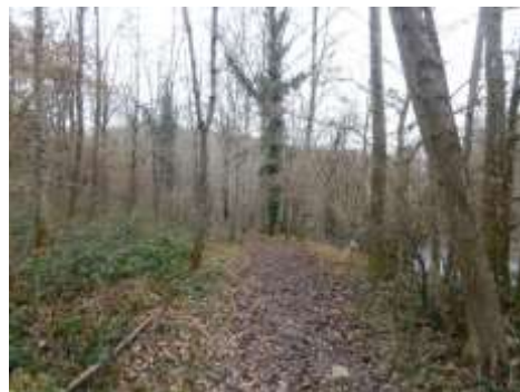
Plantation de peupliers, la Viale (Lignerolles) CEN Allier, 11/12/15