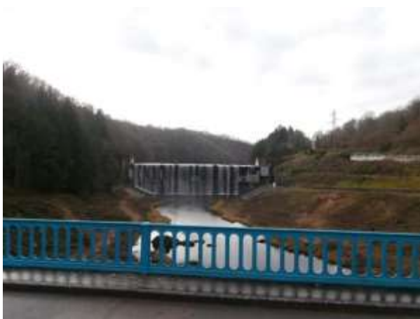
Déboisement des berges du Cher entre le pont et le barrage de Prat. CEN Allier, 11/12/15

Pour ce dernier secteur et suite à un courriel d'information transmis par les services du Pays de la vallée de Montluçon et du Cher le 27 novembre 2015, le Conservatoire a porté une observation particulière sur les travaux de défrichement réalisés par EDF sur les abords du Cher, entre le pont et le barrage. Précisons que selon l'échange entretenu entre EDF et les services du Pays, la réalisation de ces travaux a été préalablement accordée par la Direction Départementale des Territoires de l'Allier.