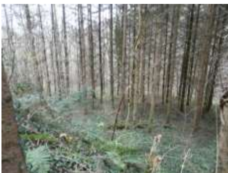
Plantation de Douglas, la Viale (Lignerolles) CEN Allier, 11/12/15

Un compte-rendu a été élaboré par le CNPF et transmis à l'UPB ainsi que la fédération départementale de pêche et de protection du milieu aquatique.