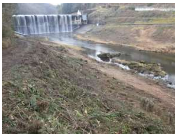
Déboisement des berges du Cher (rive droite) en aval du barrage de Prat. CEN Allier, 11/12/15

La visite du domaine de Nerdre et plus particulièrement des landes de Nerdre a quant à elle été menée en compagnie des services du Pays. Un point sur l'évolution des secteurs de lande restaurés ( contrat Natura 2000 porté par le CEN Allier de 2010 à 2014 ) a été effectué.