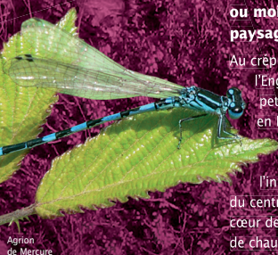
Agrion de Mercure

Les landes de Nerdre, ne faisant plus l'objet d'entretien régulier, sont aujourd'hui menacées. En effet l'augmentation des arbustes épineux et des arbres et l'envahissement par la Fougère aigle provoquent la disparition des espèces caractéristiques de la lande.